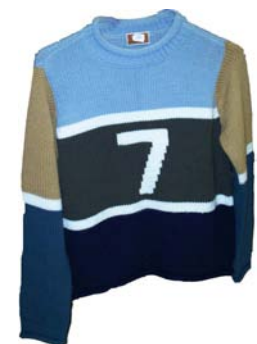
Svetr 60 Kč, Levné oděvy na náměstí

Já sama mohu nakupování v secondhandech jen doporučit – vždyť oblečení ze sekáče tvoří většinu mého šatníku :) Co se týče kvality a hygieny, bát se nemusíte, dnes je všechno zboží pečlivě vyprané. Sekáče s krabicemi, ve kterých se hrabe jsou dnes minulostí – vše je pověšené na ramíncích a sortiment, jak vidíte, je rozmanitý a moderní, takže za oblečení nemusíte zbytečně utrácet, děti stejně rychle rostou :) Mumínka