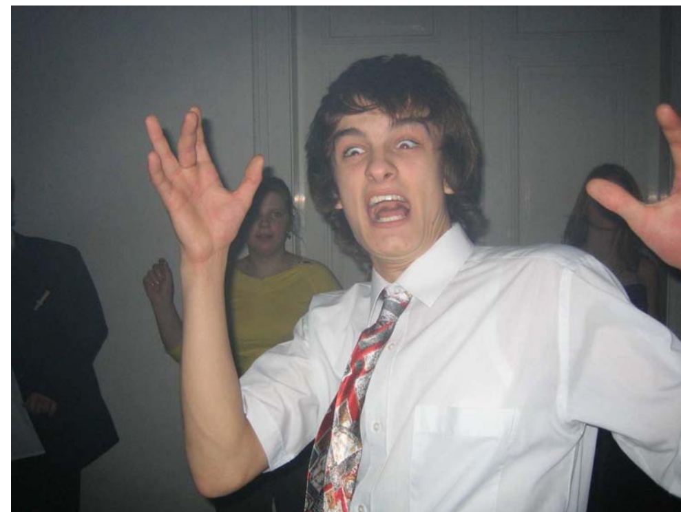
Podivné diskotékové kreace:)

P.S. Ráda bych vás všechny upozornila na změnu e-mailu: mumiiinek@centrum.cz