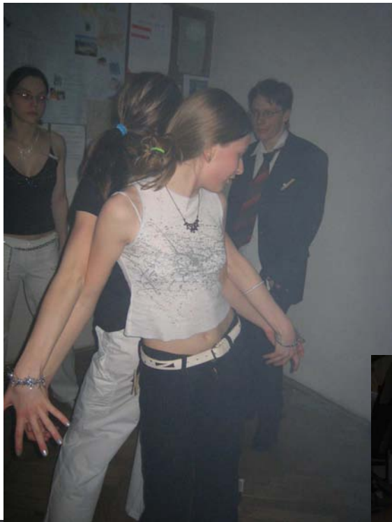
Buddha aspirující na titul „Tanečník střediska“