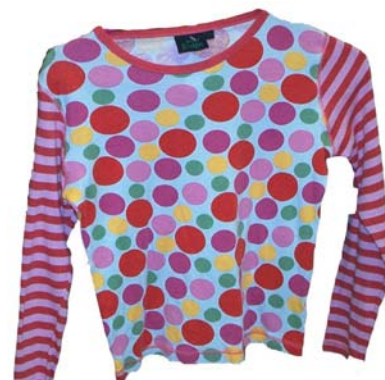
Puntíkové tričko 65 Kč, Levné oděvy na náměstí Ethnostyl, Levné oděvy na Riegrově náměstí – tričko 45 Kč, kabelka s Dalmatiny 40 Kč, zavínovací sukně 40 Kč

Riegrově náměstí v Levných oděvech je to vždy v pondělí a úterý (zboží chodí každou středu), jinak většinou jednou za 3-4 týdny. Před zbožím bývá na vše sleva 50%, potom je vše za 20 Kč a nakonec za 10 nebo 5 Kč. Takže nejvýhodněji nakoupíte v tuto dobu.