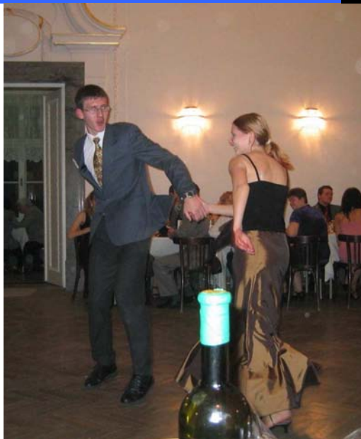
Buddha aspirující na titul „Tanečník střediska“