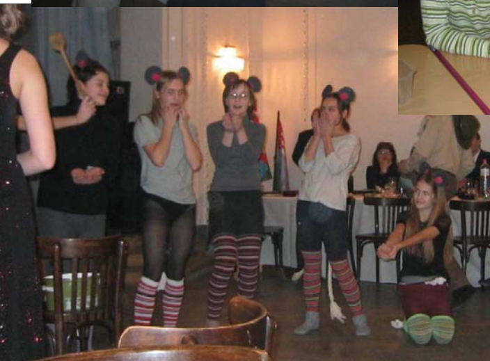
Vedle Gazelí myši taneček a nad nimi Bětín a Kájín svůdný taneček okukovaný ze všech stran:)